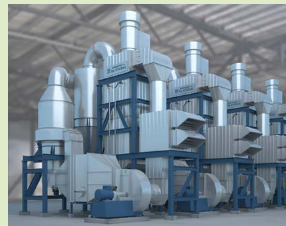
Tyypikuvassa TM System Finland Oy:n SuperDryer -kuivausjärjestelmä.

EU-komission European Innovation Council Accelerator -ohjelma rahoittaa erittäin innovatiivisia, kasvuhakuisia startup- ja pk-yrityksiä. Rahoituksessa avustuksen osuus on enintään 2,5 miljoonaa ja pääomakomponentti 0,5–15 miljoonaa euroa. Kahdella hakukieroksella ohjelma sai yli 4000 hakemusta, joista valikoitui 164 rahoitusta saanutta. Kahden turkulaisen lisäksi rahoituksen sai neljä muuta suomalaisyritystä.