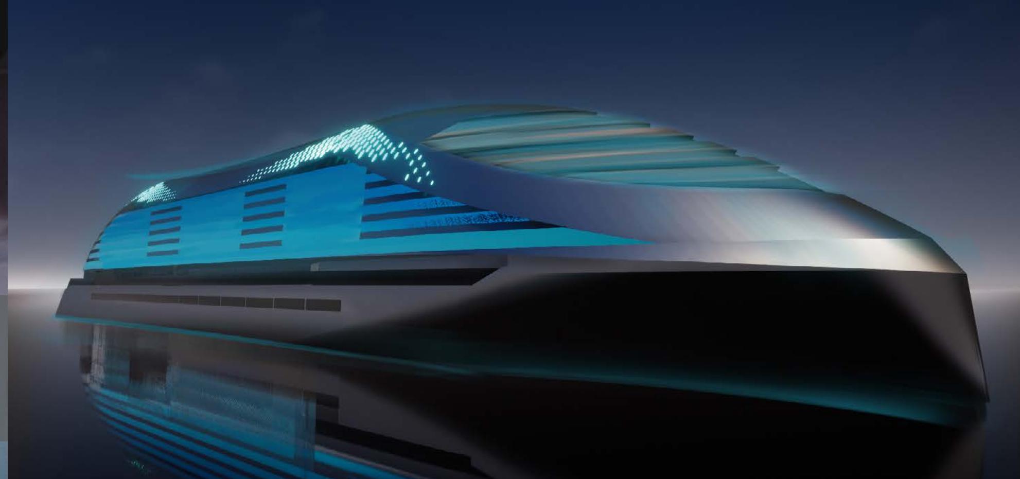
Meyer Turku Oy:n havainnekuva ilmastoneutraalista risteilijästä.