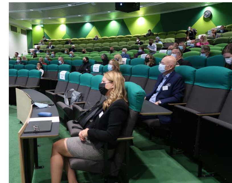
Due to COVID-19, the number of participants in the 2021 HealthBio event, among others, had to be scaled down.

The company's activities in the spearhead fields focused on sector-specific measures to increase sustainability, digitalisation and international business and attractiveness. Examples include battery industry projects supporting electrification solutions, initiatives to promote the recycling of building materials and minimise environmental impact, EDIH (European Digital Hub) project preparations supporting digital transformation and increasing the digitalisation and international competitiveness of the tourism industry.