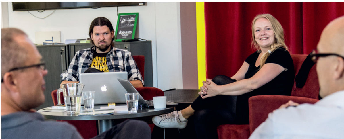
StartingUp-työpajat on yksi osa SparkUpin säännöllistä toimintaa.

ja Raision kaupunkien ohella meneillään olevat Euroopan maaseudun kehittämisen maatalousrahaston, Euroopan Aluekehitysrahaston ja Tekesin rahoittamat hankkeet.