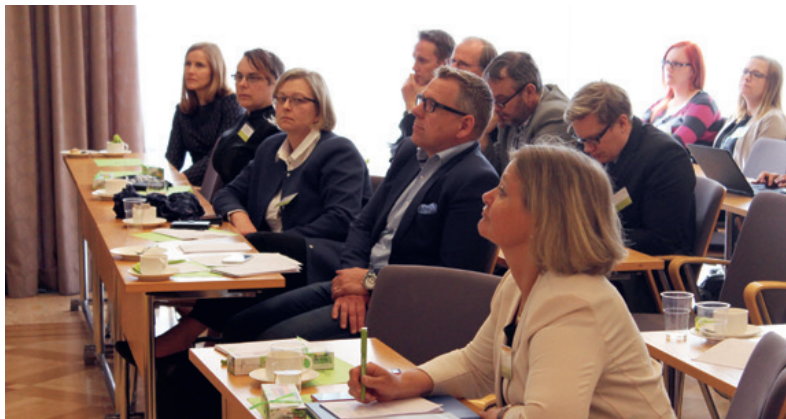
Yli 120 henkeä osallistui toukokuussa 2016 järjestettyyn Smart Chemistry Parkin Open Day -seminaariin Raisiossa.

Smart Chemistry Park on perustettu alustaksi, jolta yritykset voivat ponnistaa kasvuun ja uusille liiketoiminta-alueille. Se on niille välietappi matkalla kohti integroitumista isompaan teollisuuteen. Vielä muutamalle yritykselle on tarjolla tilaa nykyisissä tiloissa. Ympäröivällä tehta-