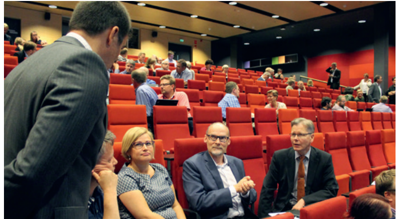
TFT-toimintaa esiteltiin elokuussa Turun seudun valmistavan teollisuuden yrityksille.

TFT-tiimi luo vuoropuhelua strategisten hankkeiden ympärille. Yksi verkoston palveluista on VTT:n ja Tampereen Teknillisen yliopiston käynnistämä yhteistyömalli SMACC. SMACC Tuumauspäivässä yrityksen nykytilaa ja kehityskohteita arvioidaan