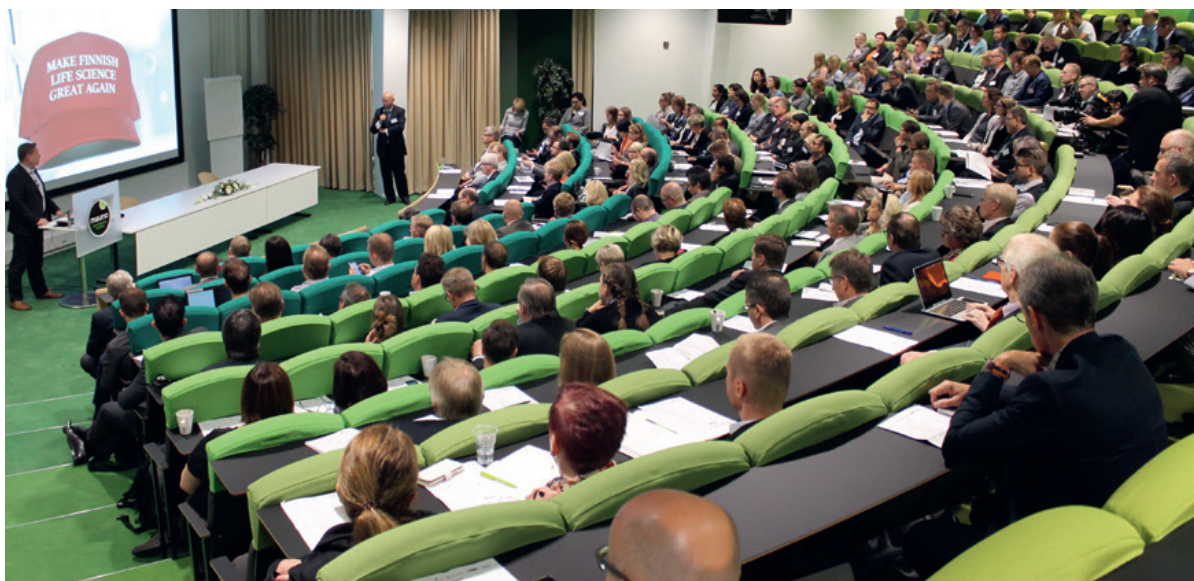
HealthBION 10:s vuosiseminaari täytti jälleen Kokouskeskus Maunon Presidentti-auditorion.